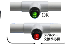
取り付け後の一例