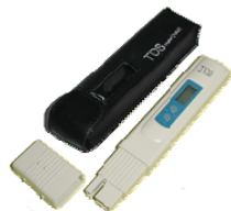
黒レーザーケース付