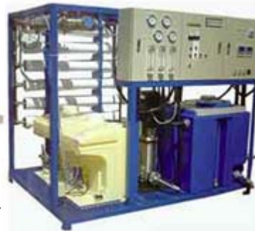
Ro 4040×6本 40インチプレフィルター×7本 圧力計×4 流量計×3

以下の写真は井戸水から40トン/日の飲料純水を生産し、飲料基準を満たすように2式の薬注装置を備えた装置です。鉄、マンガン、亜硝酸性窒素等々を95%以上除去します。