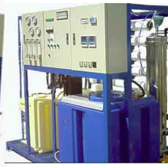
全自動制御盤 Ro逆洗浄機能 2系統備え 薬注2機(pH, 塩素センサー付属)