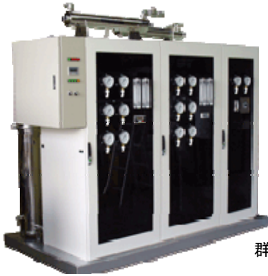
群馬県のプラスチック成形工場へ納入(30トン/日 能力) 参考価格 800 万円/式 (2007 年)

1. 窒素注入式: 熱交換(冷却水)用として、脱酸素をした純水 1~18MΩ を温調設備へ供給します。