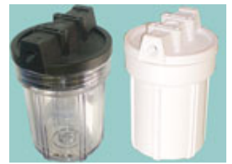
5インチタイプ 【ご注文数:12本単位】