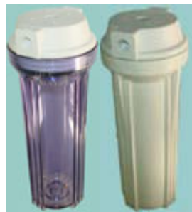
フラットヘッドタイプ 【ご注文数:15本単位】