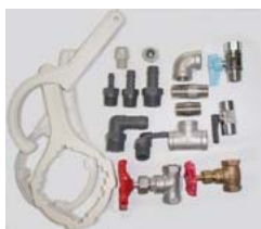
着脱ハンドル、継手類