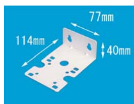
1本用 (ボタン付共用)