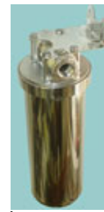
オールステンレス SUS3/4PT ブラケット付き