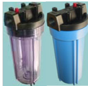
空気抜きボタン付き